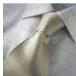
AMENO-Stresa-B-tie kan genbestilles ved min. 100 stk. / EXPIERD, can be ordered at minimum 100 pieces.