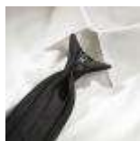
UNIFORM-Uniline-S-4-B. Safety tie clipon, polyester, navy.