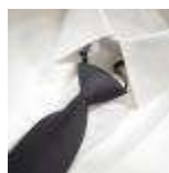
UNIFORM-Workline-S-3-B. Safety tie with elastic, polyester/wool, navy.