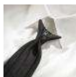
UNIFORM-Uniline-S-4-A. Safety tie with clipon, polyester, black.