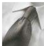
AMENO-Brescia-A-tie, Udgår, spørg på lagerantal, Expires, please ask for stock quantity.