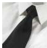
UNIFORM-Workline-S-1-A. Normal tie, polyester/wool, black.