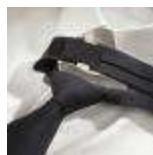
UNIFORM-Workline-S-2-B. Safety tie with velcro, polyester/wool, navy.