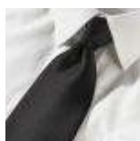
UNIFORM-Blackline-S-1-A. Normal tie, polyester, black.