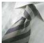
AMENO-Parma-A-tie, Udgår, spørg på lagerantal, Expires, please ask for stock quantity.