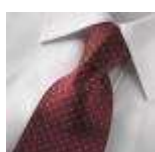
AMENO-Rimini-D-tie, Udgår, spørg på lagerantal, Expires, please ask for stock quantity.