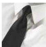
UNIFORM-Uniline-S-1-A. Normal tie, polyester, black.