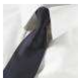
UNIFORM-Uniline-S-1-B. Normal tie, polyester, navy.

Alt i beklædning, fodtøj, rengøringsartikler og sikkerhedsudstyr, samt reklamegaver og strøartikler med tryk, broderi og gravering, efter opgave. Skilte, bannere og bilreklamer efter tilbud.