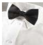
UNIFORM-Blackline-B-1-A. Bowtie, polyester, black.