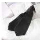
UNIFORM-Blackline-S-5-A. Ladies tie, polyester, black.