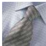
AMENO-Bergamo-C-tie, Udgår, spørg på lagerantal, Expires, please ask for stock quantity.