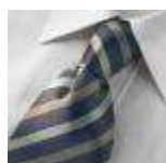
AMENO-Amalfi-A-tie Udgår, spørg på lagerantal, Expires, please ask for stock quantity.