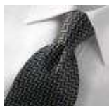
AMENO-Pisa-B-tie, Udgår, spørg på lagerantal, Expires, please ask for stock quantity.