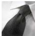
AMENO-Verona-B-tie, Udgår, spørg på lagerantal, Expires, please ask for stock quantity.

Se mere om mulighederne på vor hjemmeside: www.5610.eu > www.danskerhvervsbekaedning.dk > http://www.danskerhvervsbekaedning.dk/tilbehoer/slips/sider/341.htm