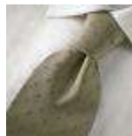
AMENO-Pavia-B-tie kan bestilles ved min. 100 stk. / EXPIRED. Can be ordered at minimum 100 pieces.