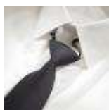
UNIFORM-Uniline-S-3-B. Safety tie with elastic, polyester, navy.