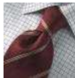
AMENO-Bologna-A-tie kan genbestilles ved min. 100 stk. / EXPIERD, can be ordered at minimum 100 pieces.