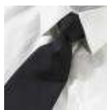
UNIFORM-Workline-S-1-B. Normal tie, polyester/wool, navy.

SE-nr. 36 70 29 66 Bank 6850 0001012998 - EMGJ Holding Aps.