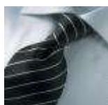
AMENO-Mantova-B-tie, UDGÅET. Kan bestilles ved min. 100 stk. / EXPIRED. Can be ordered at minimum 100 pieces.