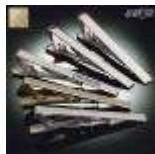
AMENO-Klemme sandblæst guld / Tieclip sandblasted gold.