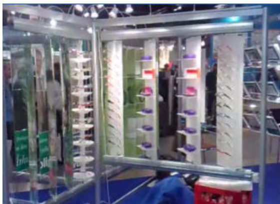
E-motion for optikere med 4 hylleblade