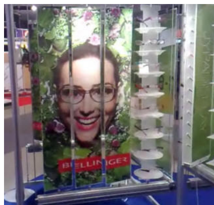
E-motion med 4x4 A4 lommer hos mægler