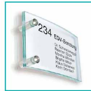
Variante-Nr. 212.004.H (horizontal montiert)