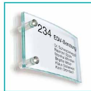
Variante-Nr. 212.004.H (horizontal montiert)

Selbstverständlich lassen sich neben den beiden Türschildtypen noch weitere Schildgrößen in der konvex geformten Ausführung herstellen. Wie nebenstehend gezeigt, bietet sich diese Form auch für die horizontale und vertikale Montage an. Auch ist die Variante als Tischaufsteller mit Namen äußerst geschmackvoll. Zunächst nur wenige Standardgrößen angeboten. Weitere Größen sind in Vorbereitung oder auf Anfrage.